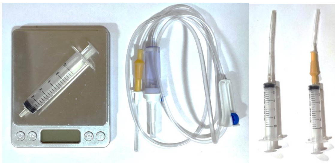
Рис. 2. Дополнительное оборудование для проведения динамического sag test.

Подготовительный этап – калибровка* шприца на дистиллированной воде